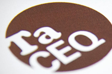
Table DE CONCERTATION ÉTUDIANTE DU QUÉBEC

Le système de classification a été choisi afin de faciliter le repérage des items, et de bien identifier quel moyen et quel indicateur est lié à quel objectif. Les indicateurs choisis, quantitatifs et qualitatifs, dénotent le succès des objectifs eux-mêmes, et non des moyens. Les éléments tirés directement d'une résolution du Caucus des associations ou du Conseil d'administration, lors des séances d'orientation ou autres, sont identifiés par le numéro de la résolution. Chaque numéro de résolution indique l'instance (CAE ou CA), la session de son adoption (H13 ou E13), la date exacte de la séance (mois-jour), et son rang d'adoption au cours de la séance.